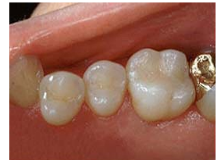
Keramikinlay neben Goldinlay nach dem Einsetzen

oder silberfarbenen „Blitzer“ beim Lachen oder Sprechen auftreten. Darüberhinaus ist es absolut glatt, sehr gut gewebeverträglich (biokompatibel) und zeichnet sich durch eine hohe Verschleißfestigkeit aus. Außerdem kann man Keramikinlays in manchen Fällen graziler als Goldinlays gestalten und dadurch weniger gesunde Zahnhartsubstanz bei der Präparation opfern.